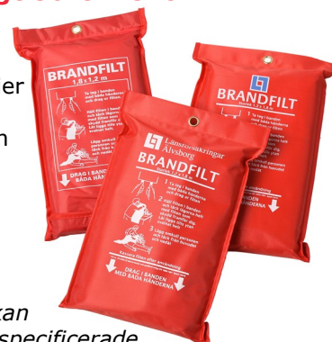
Brandfilterna kan beställas kundspecifiserade, t ex med egen bild eller logotyp

Som komplement till brandfilterna finns även svetsduk och svetsdraperier i sortimentet. De ska användas vid heta arbeten för att skydda kringliggande material från svetsloppor. Brandfilter är inte lämpliga för det ändamålet.